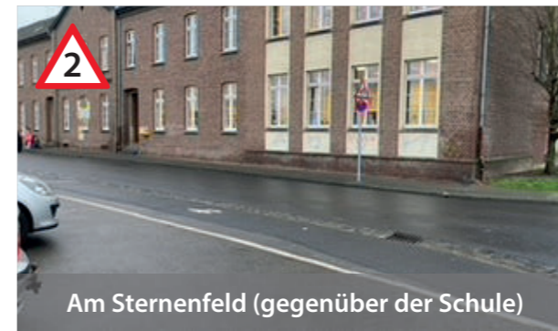
Am Sternfeld (gegenüber der Schule)

Achtung! 4 versetzte Straßen. Sehr unübersichtlich. Unbedingt Verkehrsinseln benutzen.