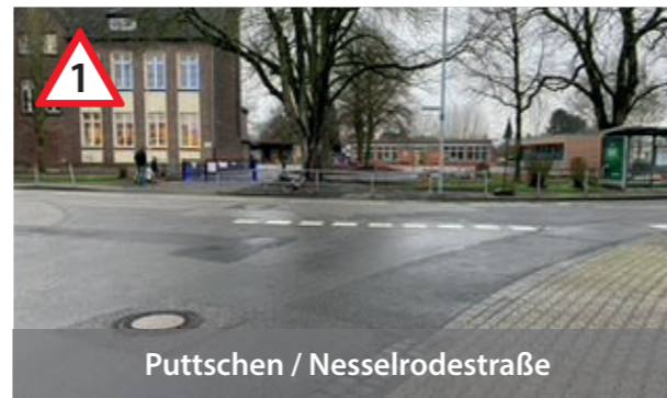
Puttschen / Nesselrodestraße

Achtung! 4 versetzte Straßen. Sehr unübersichtlich. Unbedingt Verkehrsinseln benutzen.